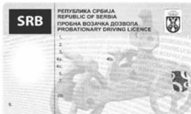
Naličje probne vozačke dozvole